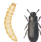
MELBILLER. Angriper melprodukter. 4-6 mm. Larvene blir opptil 10 mm.