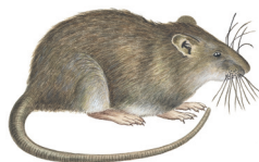
ROTTER. Altetere. Smittespredere. Blir 21-27 cm uten halen.