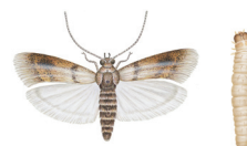
MELMØLL OG TØRRFRUKT-MØLL. Lever av mel, nøtter, tørket frukt. 14-25 mm mellom vingespissene. Larven blir 10-15 mm.