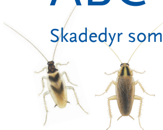
KAKERLAKKER. Altetere. Kan spres til huset med varer. 10-35 mm.