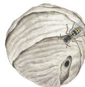
VEPS/BIER. Store bol kan være vanskelig å fjerne.